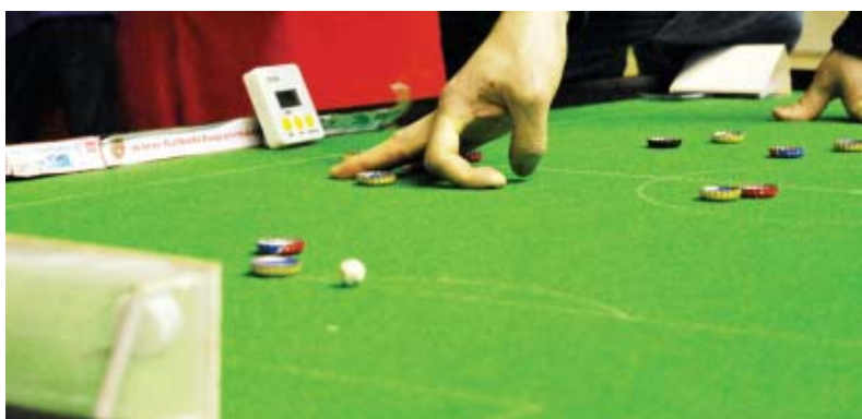
Uno de los participantes dispara a gol.