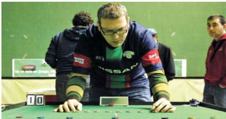
Uno de los jugadores defiende su portería.